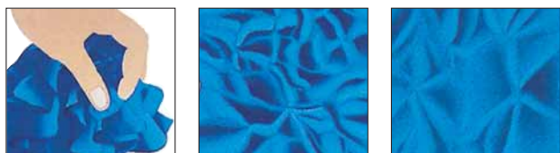
La preuve en accéléré: Trevira Perform se défroisse tout seul.

L'élasthane est partout. Toutefois, son extrême élasticité est pratiquement incontrôlable en l'absence de mélange à d'autres fibres textiles. Trevira Perform est le partenaire idéal du stretch.