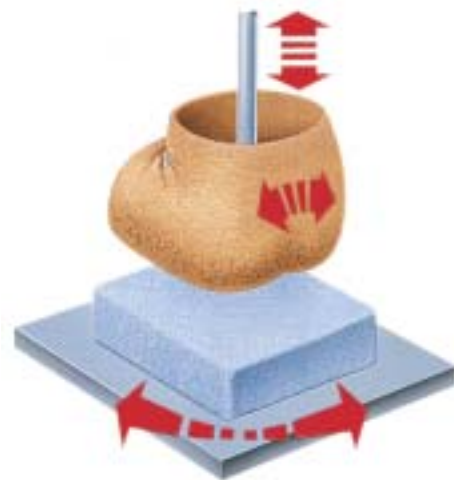
Dieser Test simuliert die typische Sitzmöbelbeanspruchung. Dabei zeigt Trevira CS hohe Scheuer- und Abriebfestigkeit.