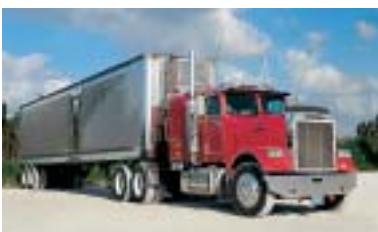
Noch mehr Sicherheit im Straßenverkehr dank flammhemmender Ausstattung.