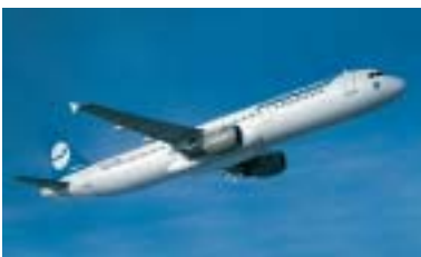
Über den Wolken sind die Anforderungen an Stoffe extrem hoch.