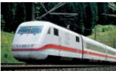
So bringt man alle Vorteile von Sicherheitsstoffen auf die Schiene.