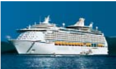
Absolut hochseetauglich müssen Stoffe für Passagierschiffe sein.

Weil Sicherheit auch gut aussehen muss, bieten weltweit namhafte Hersteller und Verlage über 1.000 unterschiedliche Kollektionen aus Trevira CS Stoffen an. Diese Auswahl gibt Ihnen die Möglichkeit, jedes Transportmittel in allen textilen Elementen – von der Bestuhlung bis zur Dekoration – sicher zu gestalten; selbstverständlich auch in den Corporate-Design-Farben jedes Unternehmens.